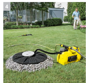
4 Оптимальное всасывание