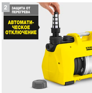
2 ЗАЩИТА ОТ ПЕРЕГРЕВА АВТОМАТИЧЕСКОЕ ОТКЛЮЧЕНИЕ